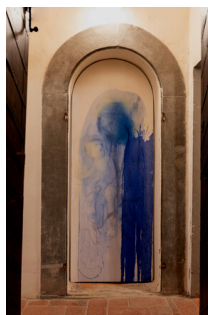
Madonna , 2022 Tecnica mista su legno