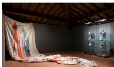
Sindone , 2012 Tecnica mista su cotone

Nella teca: Adamo ed Eva , 2017 Ceramica smaltata 6/100 elementi