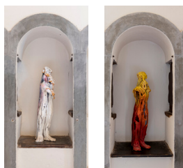
San Sebastiano , 2005 Ceramica smaltata e dipinta, poliuretano (in collaborazione con Mutsuo Hirano)