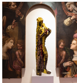
San Sebastiano , 2005 Terracotta dipinta a freddo

Nella teca: Adamo ed Eva , 2017 Ceramica smaltata 6/100 elementi