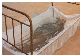
Il letto di Euridice , 2000 Tulle, pittura, ferro